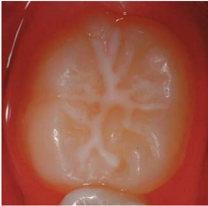
Abb. 1: Intakte Fissurenversiegelung.